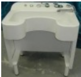
Đ'Đ°Đ'½Đ'½Đ° AQUAMANUS (ĐiĐ»Đ¾Đ²Đ°Đ°Đ, Ñ•) 1 600.47 Đ ÑfĐ±.