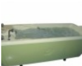
Đ'Đ°Đ'½Đ'½Đ° Đ±Đ°Đ»Ñ€Đ'½ĐμĐ¾Đ»Đ¾Đ³Đ, Ñ‡ĐμÑ•Đ°Đ°Ñ• LAGUNA Plus Bubble (ĐiĐ»Đ¾Đ²Đ°Đ°Đ, Ñ•) 5 931.14 Đ ÑfĐ±.