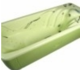
Đ'Đ°Đ'½Đ'½Đ° Đ'Đ»Ñ• Đ¿Đ¾Đ'Đ²Đ¾Đ'Đ'½Đ¾Đ³Đ¾ Đ¼Đ°Ñ•Ñ•Đ°Đ¶Đ° Ocean Economy (ĐiĐ»Đ¾Đ²Đ°Đ°Đ, Ñ•) 4 790.57 Đ ÑfĐ±.