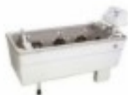
Đ²Đ°Đ'½Đ'½Đ° BOPARD UW 1800 AC 7 905.14 Đ ÑfĐ±.